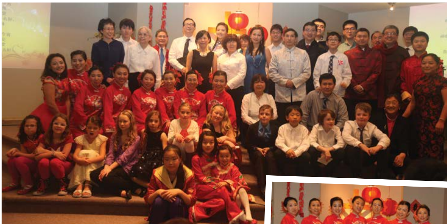
2015 舊曆新年 Chinese New Year