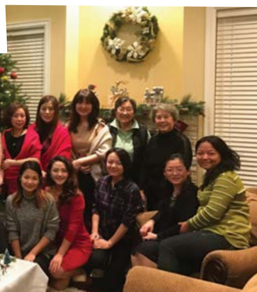
2016 聖誕節 Christmas