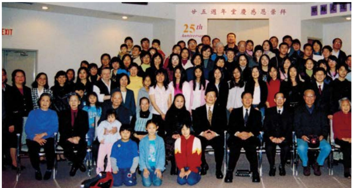
2004 | 25 週年堂慶 25th Anniversary