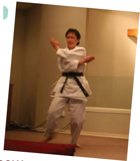
2007 功夫秀 Kung Fu Show