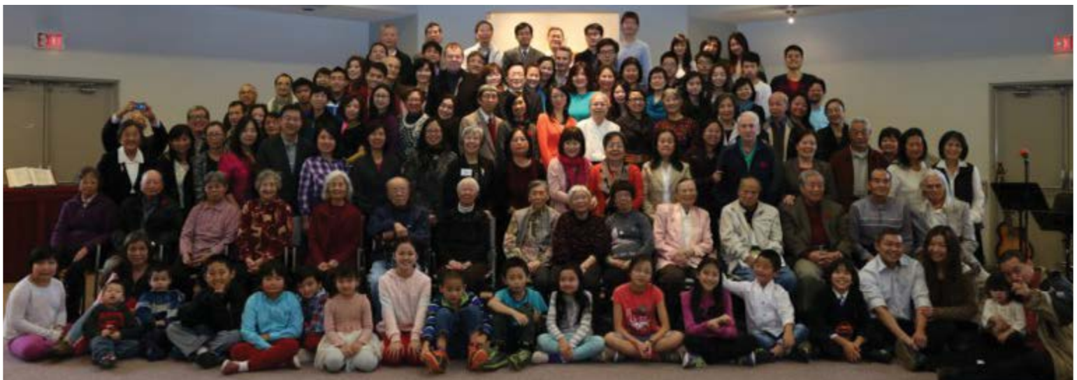
主日學老師授禮 Sunday School Teacher Installation