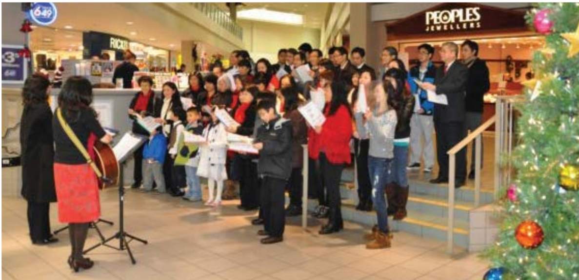
2011 報佳音 Caroling